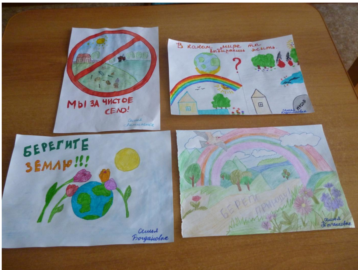
Рисунки родителей и детей.