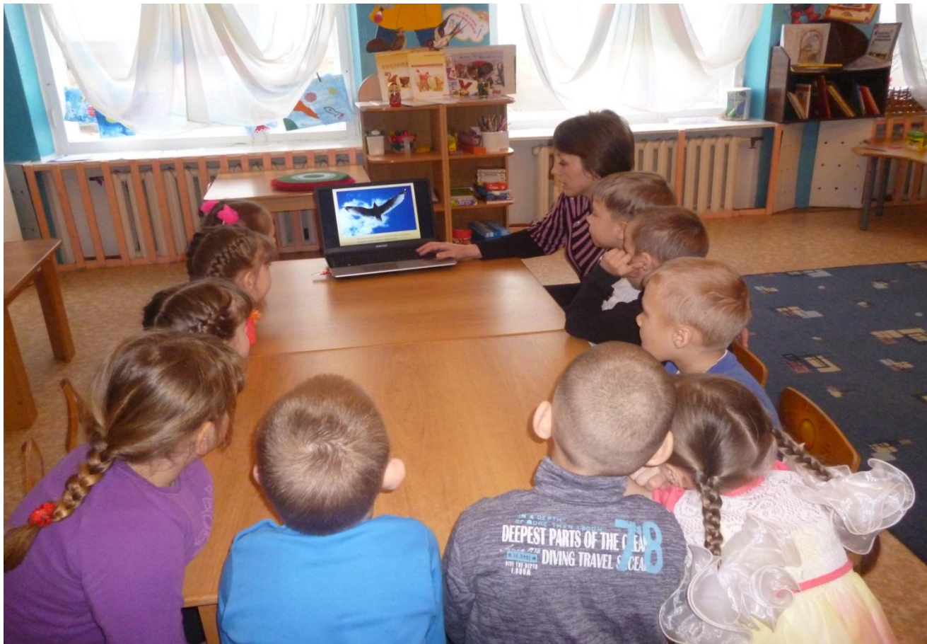
Презентация «Загрязнение окружающей среды».