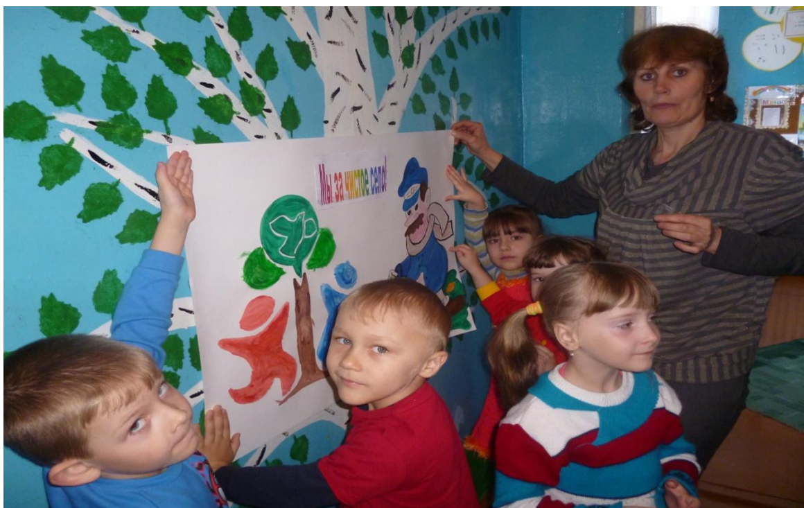
Плакат для родителей.